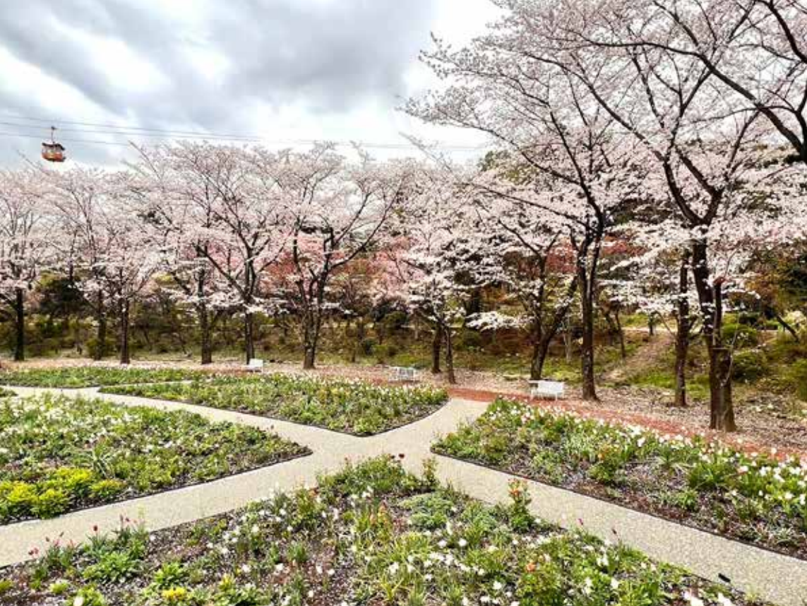
Oudolfs beplantingsplan voor de tuin in Tokyo is aangevuld met een voorjaarsbollenplan ontworpen door Yuko Nagumura. In de vroege lente geeft dat een interessante combinatie met de iconische bloeiende Japanse sierkersen ( Prunus x yedoensis ).